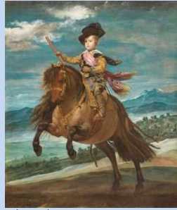
ディエゴ・ベラスケス 《王子プリタサル・カルロス騎馬像》 1635年頃 マリノ、プラド美術館蔵